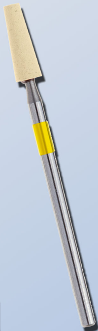
367 4 HP